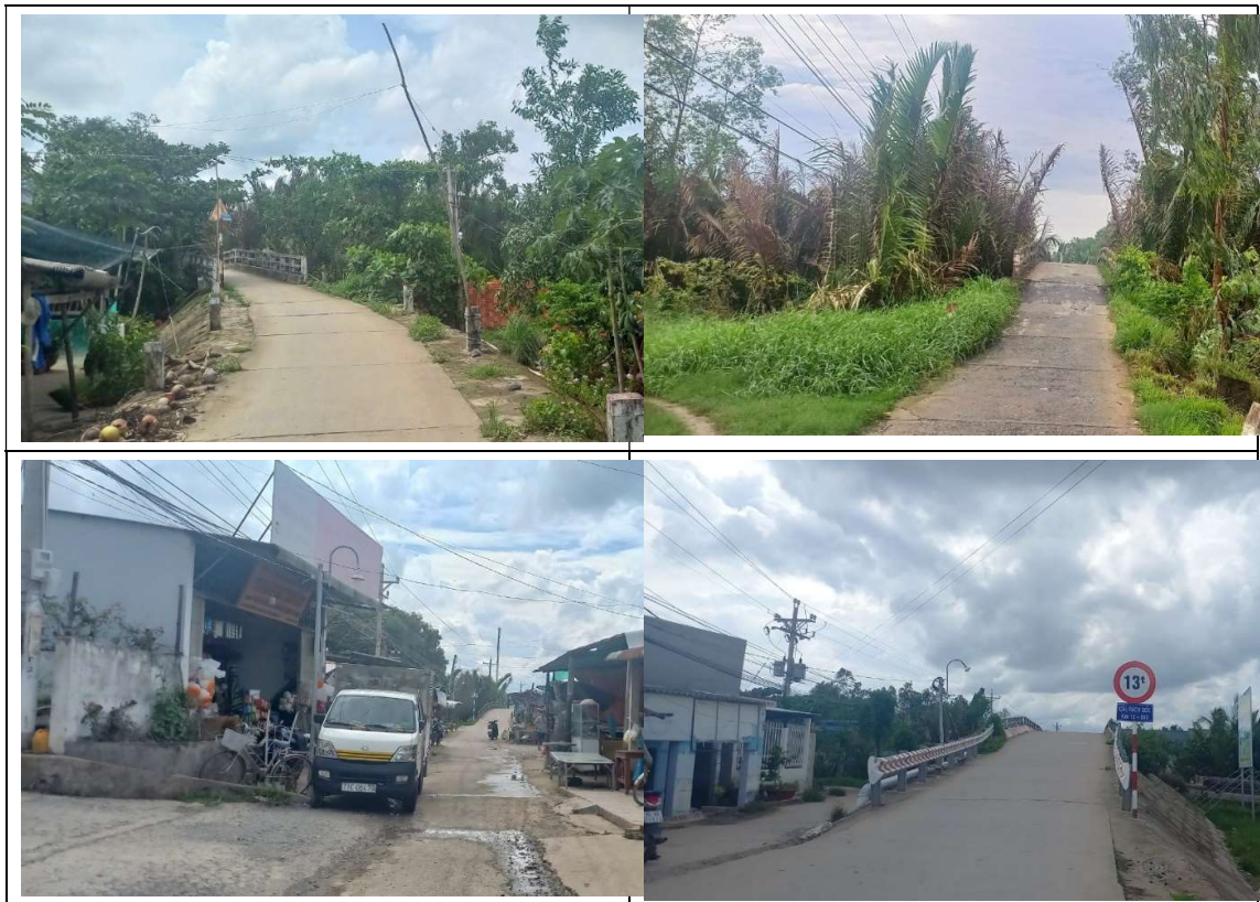
Hình 2: Một số hình ảnh hiện trạng khu vực thực hiện Dự án

(Đoạn từ Km11+303,39 – Km13+587,57 và đoạn từ Km14+310,63 – Km15+176,11 đã được đầu tư đường bê tông nhựa hoàn chỉnh nên không đầu tư trong dự án này).